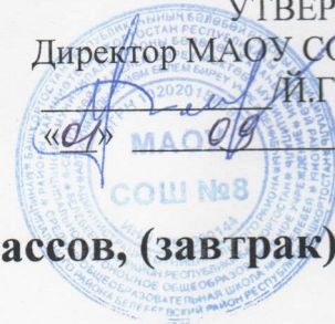
График приема пищи обучающимися 1-4 классов, (завтрак)